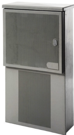
Telaio di ancoraggio fornito a corredo >>>>