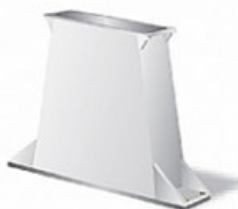
Basamento in vetroresina