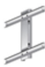
Staffa fissaggio a palo