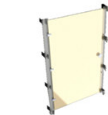
Controporta fenolica / metacrilato