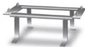
Telaio di ancoraggio al suolo