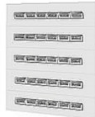
Telaio modulare DIN