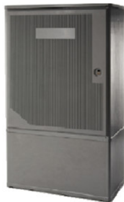
Telaio di ancoraggio al suolo in acciaio incluso GTWSN